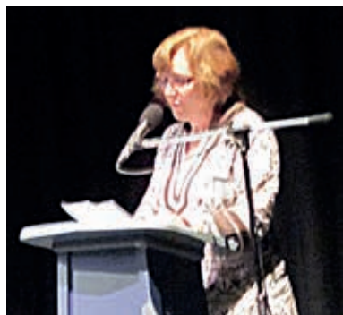
Recital de poesía en Salobreña