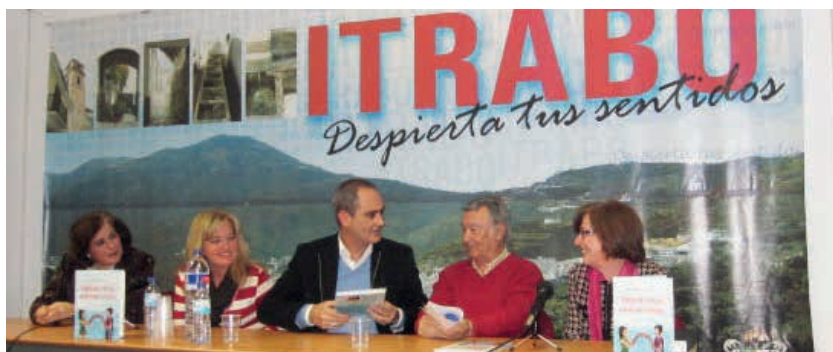
Presentación del cuento en Ítrabo