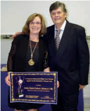
Entrega de Medalla de Oro y diploma de Granada Costa