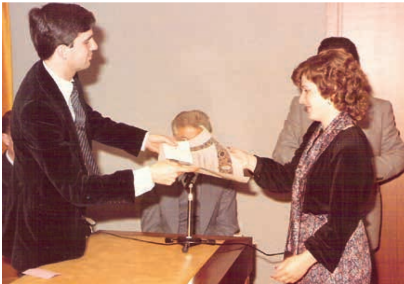
Recogiendo un premio de poesía