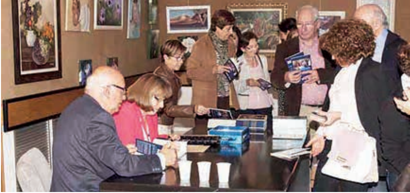
Firma de libros tras la presentación del libro Navegando entre sueños en Paguera, 2012.