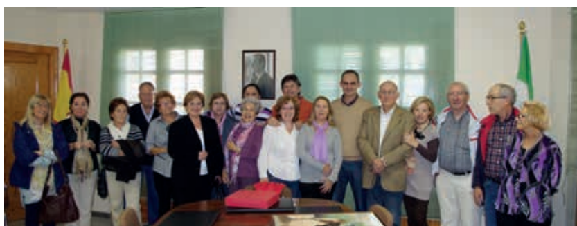
Grupo de amigos de Mallorca en el ayuntamiento Ítrabo