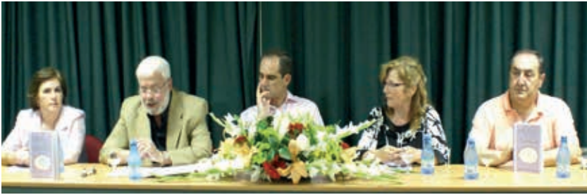
Presentación en Ítrabo, Granada, Reflejo del Sentimiento, 2009