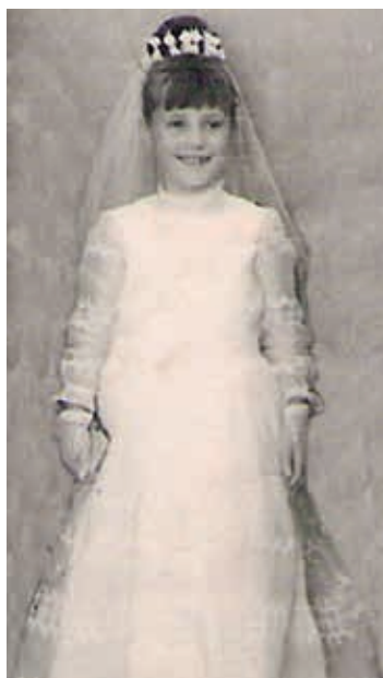
El día de su primera comunión