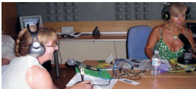
Entrevista en la radio, Almuñécar