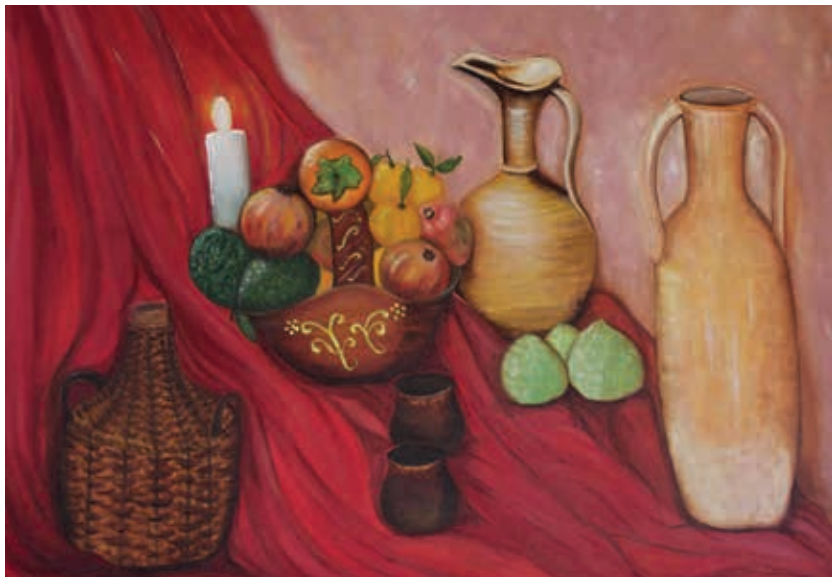
Bodegón donado a la Fundación Granada Costa en 2012