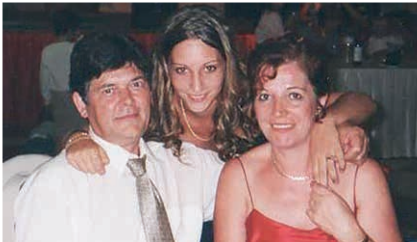
De celebración con su marido y su hija