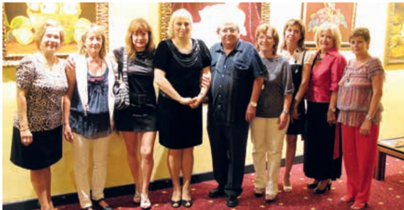
Exposición en el casino de Mallorca con compañeras