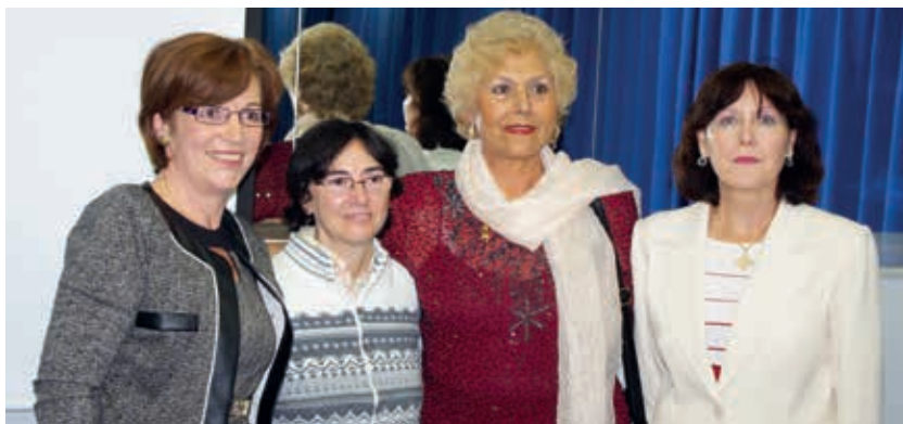
En el Hotel Helios, almuñécar, junto a compañeras de Granada Costa