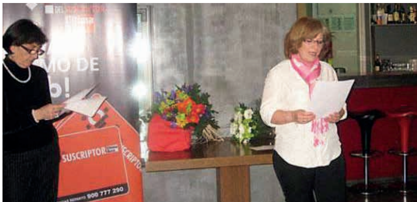
Premio de relatos 2011 del periódico ultima hora de Baleares