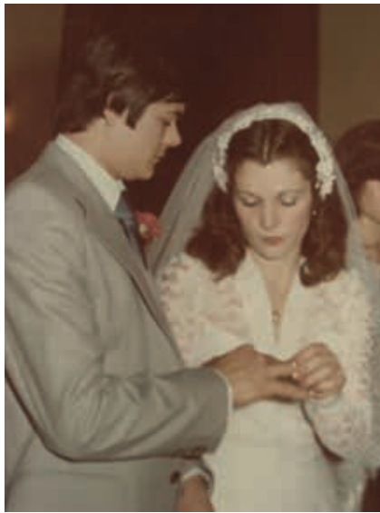
En el día de su boda